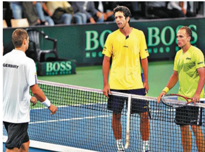
Na queda diante da Alemanha, única vitória brasileira veio nas duplas

Também já estão definidos os confrontos da primeira fase do Grupo Mundial do ano que vem: República Checa x Holanda, Japão x Canadá, Alemanha x Espanha, França x Austrália, Estados Unidos x Grã-Bretanha, Argentina x Itália, Cazaquistão x Bélgica e Sérvia x Suíça.