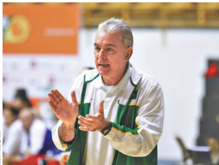
Zanon planeja mais rodagem para as novatas da seleção feminina

Já classificados para o Mundial de Basquete, Canadá e Cuba se enfrentaram na decisão da Copa América no México, e a seleção caribenha levou a melhor, vencendo as canadenses, invictas na competição, por 79 a 71. Assim, conquistaram o título continental.